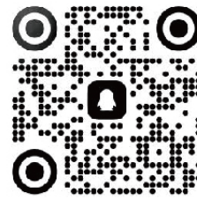
2026研究生新生交流群