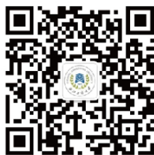
浙商大研究生教育

另：新生可关注微信公众号“浙江工商大学研究生教育”获取更多相关信息。若有入学方面的问题，可加入“2026研究生新生交流群”（250823317）QQ群、添加微信公众号“浙商大研究生会”，或搜索“浙江工商大学研究生会官方微博”进行咨询。